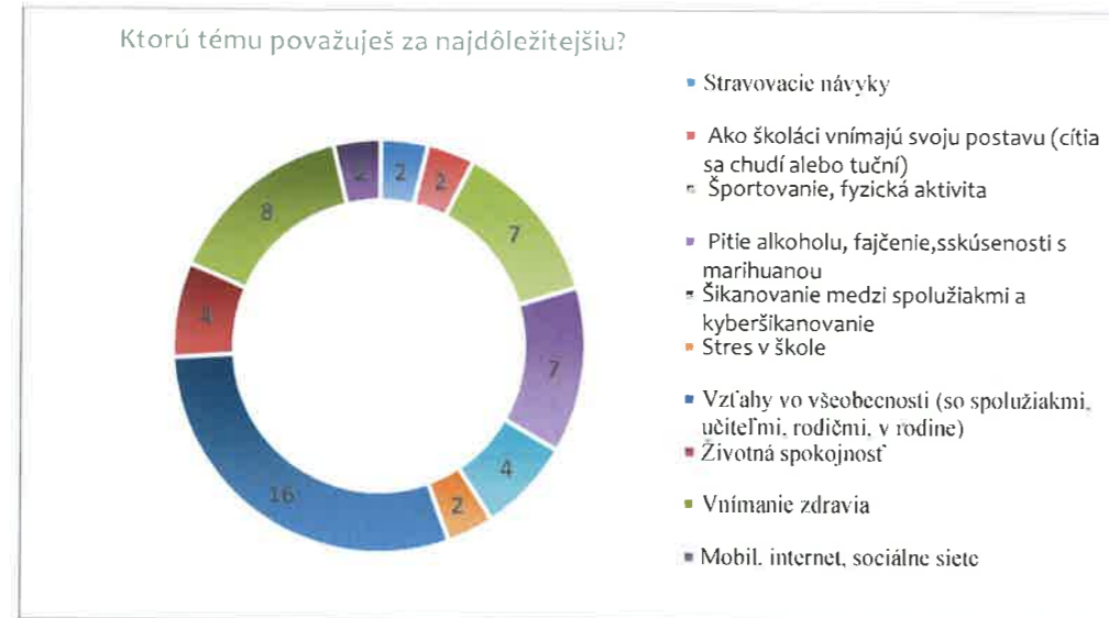
Obrázok 2 Najdôležitejšie témy výskumu HBSC z pohľadu mládeže

Ďalšou oblasťou nášho výskumu bol spôsob, akým by mala sieť HBSC zdieľať správy a získané informácie zo svojho výskumu s mladými ľuďmi. Sociálne siete, videoblogy a videá sa javia najpreferovanejšou metódou šírenia výskumu (obrázok 3). Toto poskytuje užitočný prehľad o spôsoboch, akými sa mladí ľudia domnievajú, že budú s najväčšou pravdepodobnosťou mať prístup k zdrojom HBSC, pričom sociálne médiá a videá budú podľa všetkého preferovanými možnosťami.